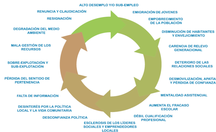
Proceso de desvitalización de zonas rurales 9

Este contexto generalizado, con la presión adicional ejercida por la crisis socioeconómica iniciada en 2007, exige una profunda reflexión sobre el enfoque, instrumentos y resultados de las acciones públicas destinadas a mejorar las condiciones de vida de quienes residen en el medio rural. Si no se ha avanzado adecuadamente hasta el momento es hora de que pensemos en nuevos espacios y desde la sabiduría colectiva en qué y cómo mejorar nuestros modos de vida actuales. Los territorios rurales son un eje fundamental a donde dirigir las miradas por ser la base de numerosos de los recursos de los que actualmente dependemos.